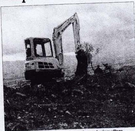
Les travaux se déroulent sur le plateau, au-dessus du vieux village.

U ne mini-pelleuse vient d'intervenir sur le plateau au dessus du vieux village. Celle-ci a permis de terrasser un accès à cet endroit par le haut, près des ruines du château médiéval. Cette intervention est faite dans le cadre du programme ambitieux d'aménagement touristique de ce lieu par l'association des Amis du vieux Marsanne. D'ici quelques jours, ce nouvel accès sera très utile aux techniciens de l'entreprise chargée du feu d'artifice du marché de Noël, dont plusieurs pièces seront tirées de cet endroit, et qui promet d'être particulièrement somptueux cette année. Samedi 11 décembre à 22 heures.