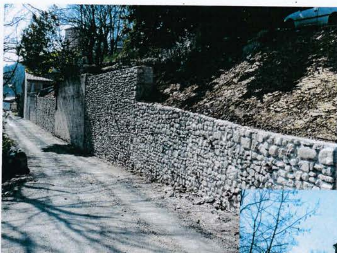
Reconstruction des murs chemin du Ventol