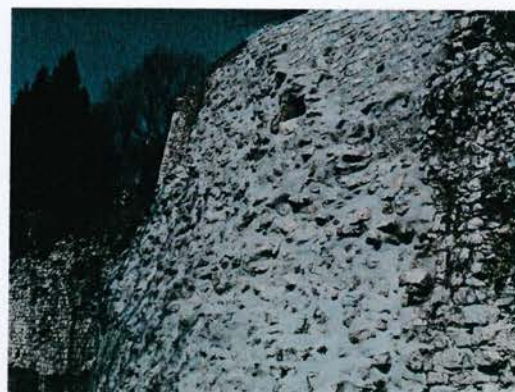
Réparation des remparts