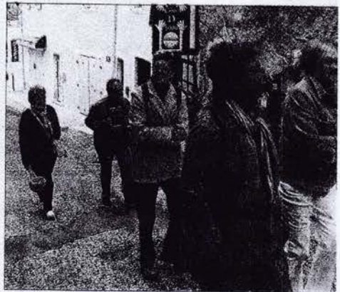
Les visiteurs grimpent au vieux village.

La météo y est pour quelque chose : la pluie battante de la matinée avait laissé la place à un ciel gris et frisquet. Comme on peut le constater, les visiteurs avaient pensé à se vêtir en conséquence !