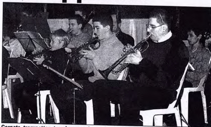
Cornets, trompettes, trombones, tubas et bugles composent l'ensemble «Persemar» qui rassemble des élèves de tout âge