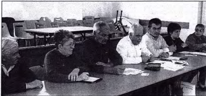
Le bureau conduit son programme avec patience et ténacité.