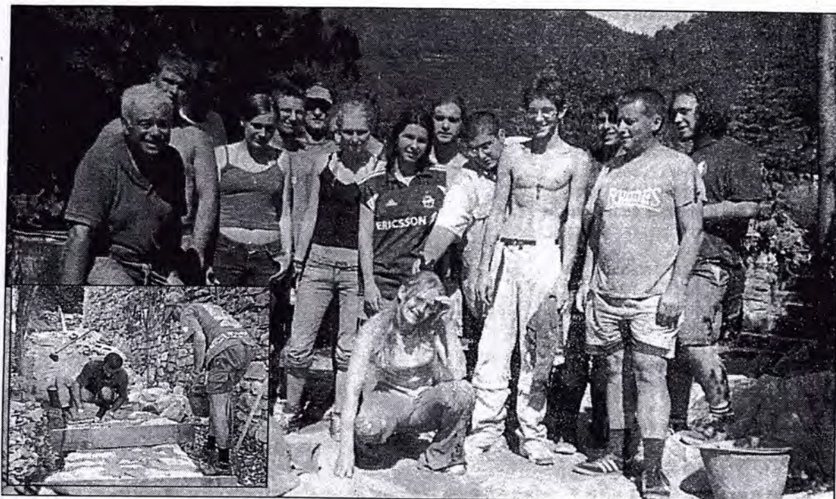
Le groupe au repos... et au travail.