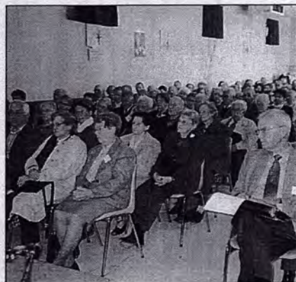
Le bureau, l'assistance

Dernièrement, l'assemblée générale de la Société de Sauvegarde des monuments anciens de la Drôme s'est tenue à la salle polyvalente de Marsanne.